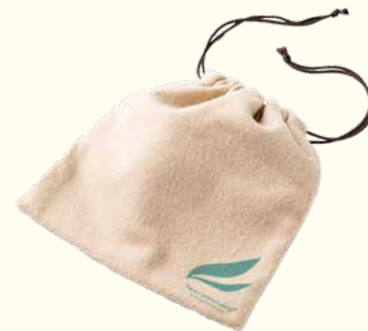
ショッパー・巾着袋